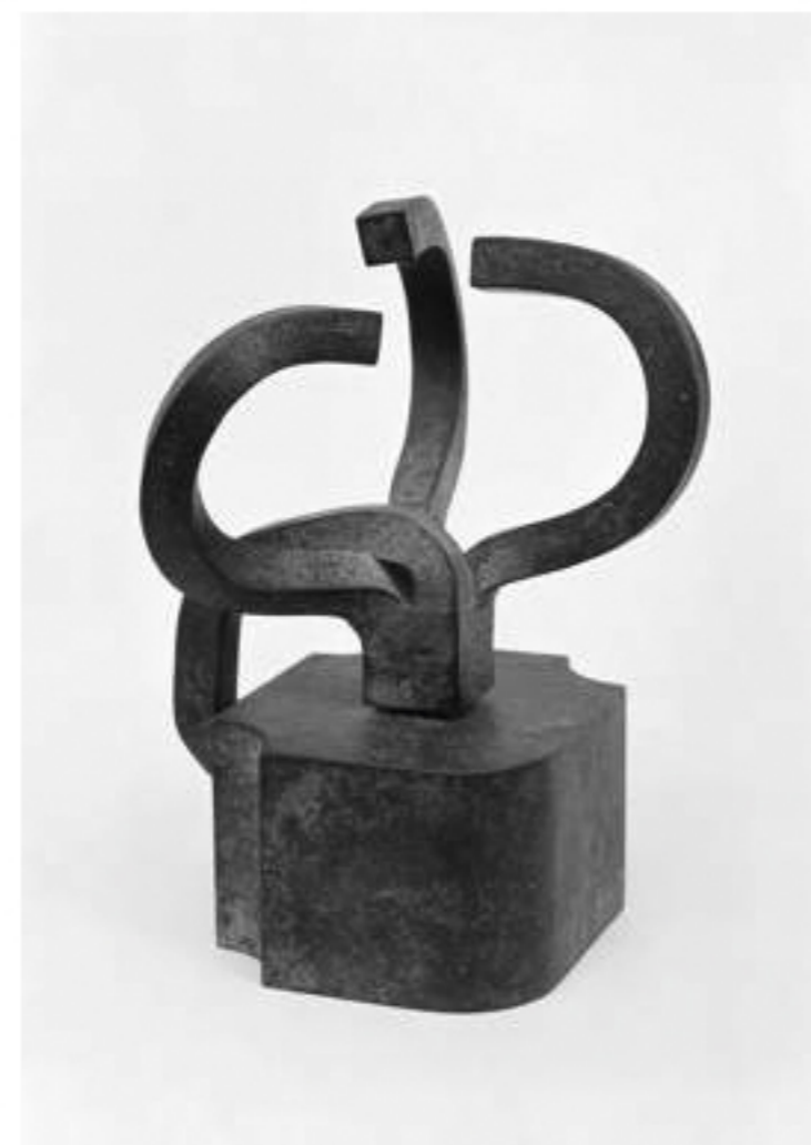
Eduardo Chillida, Ontwerp voor Peine del Vento VII, 1978